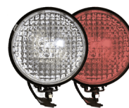
фары на СИМ